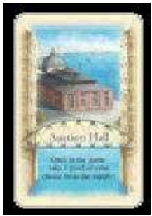
オークション・ホール

このカードを買ったら、2枚のブレイクカードも取ります。フェイズ2の購入の時に、駒を置く代わりに、ブレイクカードを捨てることによりパスすることができます。これによって後から駒を置くことができるようになり、有利に進められます。2枚のブレイクカードを使ったら、このカードも捨てカードにします。